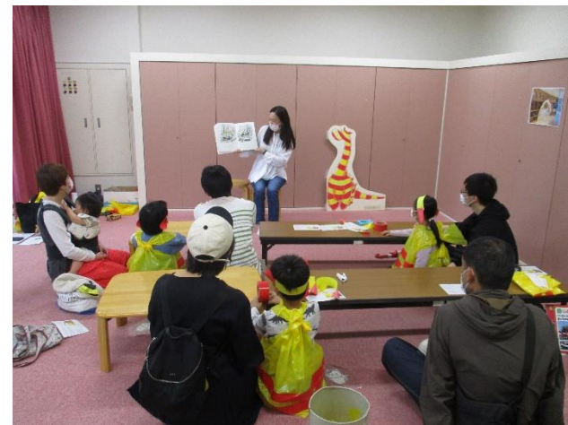
▲ちびっこへなそうるワークショップ &おはなし会