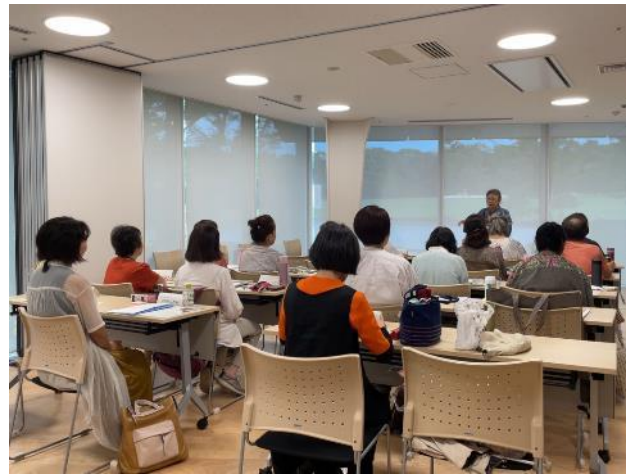
▲「図書館で」朗読やってみよう！！