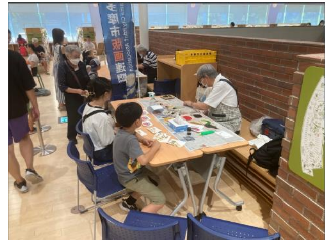
▲多摩市の鳥「ヤマバト」を摺ってみよう！