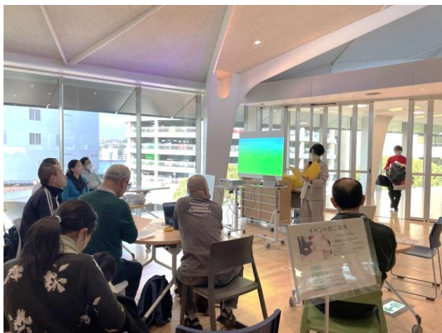
▲Library talks～図書館なんでもトーク～