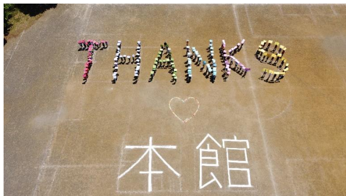
▲とどけメッセージ! 本館閉館記念写真撮影