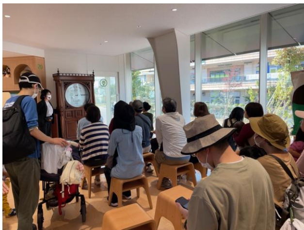
▲自動演奏楽器ミニコンサート