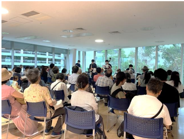
▲図書館でジャズライブを楽しもう！