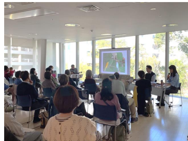
▲音と楽しむ おはなし会