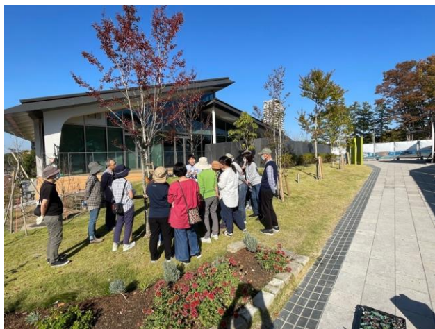
▲多摩中央公園ガーデンクラブ体験会