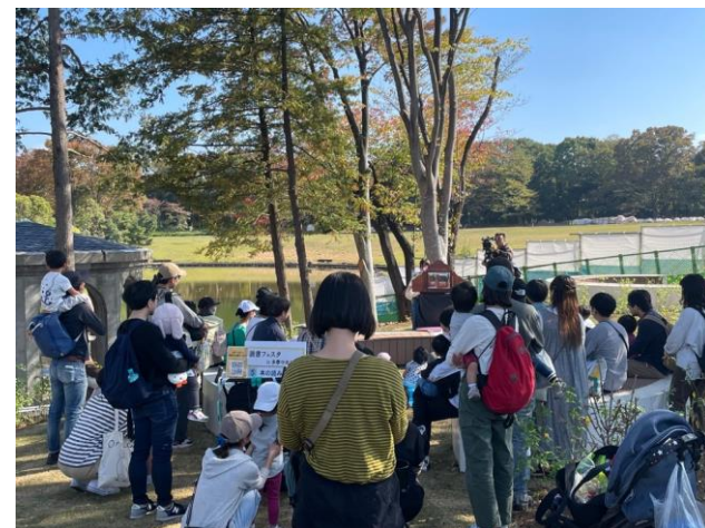
▲ブックパークでの本の読み聞かせ