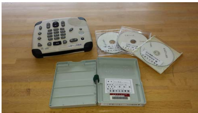
デイジー再生機(プレクストーク)