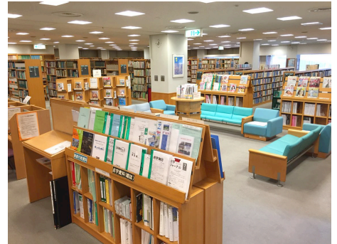
便利な駅前にある永山図書館の開架室

通勤通学の駅近の図書館では、夜間開館や自動返却、予約貸出など、クイックで利便なサービスに重点をおきます。新刊や新聞雑誌など、新しい情報を充実させ、本館との連携で専門性を補完させます。開架室を滞在型に再配置して、人の居場所を充実させて、少集会や展示も取入れたいものです。