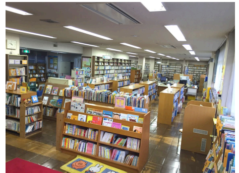
地域に向き合う東寺方図書館の開架室

子どもやお年寄りが日常的に生活圏の中で利用する図書館では、長時間開館や自動化機械貸出への投資よりは、全てに対応できる少数精鋭の職員が、ニーズに沿った資料を揃えて、多様な出会いの場を演出する、ふれあいを大切にするサービスが求められます。地域の学校との連携の拠点にもなります。