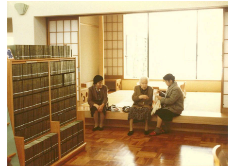
畳の読書席、縁側に腰掛ける年配のご婦人