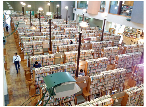
大きな資料世界がひろがる中央図書館の風景

将来の中央図書館では、他市の成功事例を研究して、全出版物に対する収集カバー率や相対中央館アクセス率を高め、ワンストップで目的の資料に利用者がアクセスできる資料の体制を構築したいところです。多摩市内で、もっとも多くの幅広く、奥行き深い、現物の資料世界の中に入り、ブラウジングし、一冊の本を越えた資料の関係性を体感する開架です。