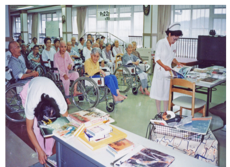
病院に出掛けてゆく貸出サービス

また、それぞれの図書館に近くの団体のご希望があれば、学級招待や開館前利用など柔軟に受け入れ、利用団体との信頼関係が緊密になるように動きます。