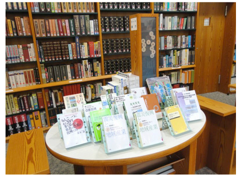
まちづくり、復興のためにはたらく図書館

利用者サービスのより一層の向上のため、 新しい技術 や他の図書館及び 異業種の発想や手法 を積極的に学び活用することにより、 弾力的かつ効果的な管理・運営 に努めます。