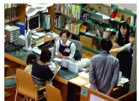
こころ強い司書さんがいるレファレンスデスク