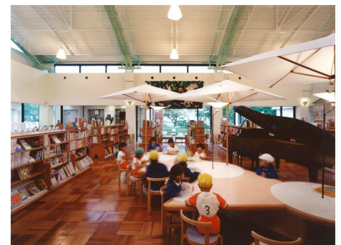
保育園児たちの早朝利用、ピアノがある開架室