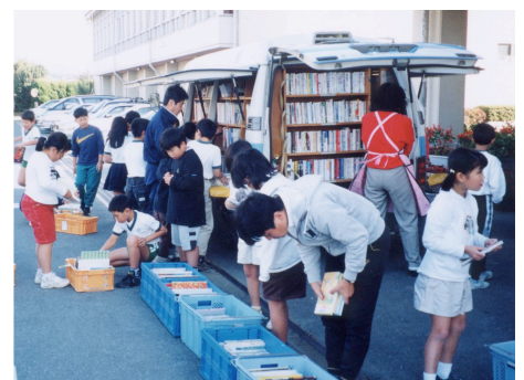
学校に出掛けて本箱を並べた直接貸出サービス