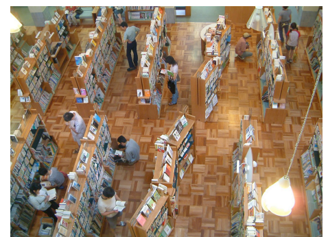
それぞれの「本と市民の出会い」がある開架室