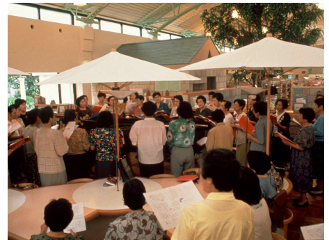
開架室で、コーラスのイブニングコンサート