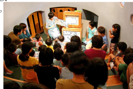
お話会という図書館との出会い