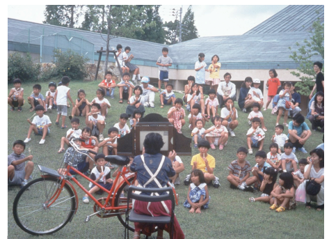
芝生の築山を客席に、図書館員が昔風の紙芝居

中央図書館候補地は、ニュータウン歩行者専用路網の南のフォーカスに並ぶ構想です。魅力的な新しい活動の拠点がこの焦点にセットされて、多摩センター駅から南側に遠い住宅地からの歩行者や自転車動線もこの求心点に集まって、自宅と駅間のバスの往復移動にも変化が起きるでしょうか。コミュニティバスの停留所もほしいフォーカス拠点です。