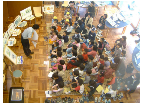
みんなで、絵本作家さんとお話をする