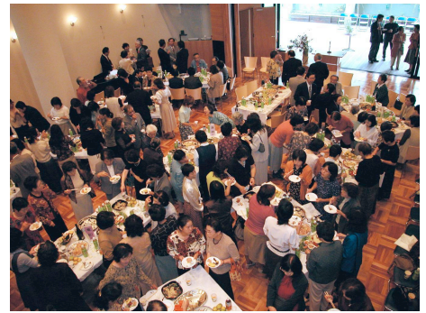
料理を持ち寄り図書館集会室でパーティ