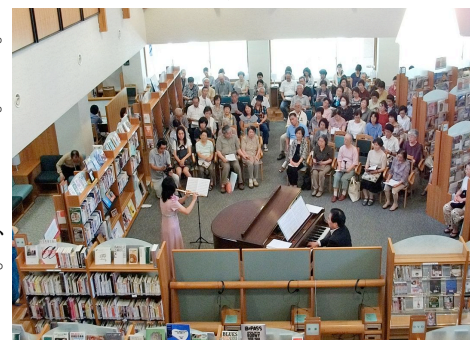
ひろば型の開架室でイブニングコンサート