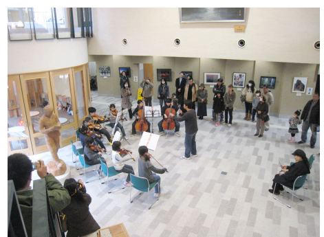
ギャラリーフリースペースで、小学生の管弦楽