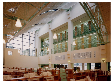
開架室の奥、見えて入れる公開書庫という形式