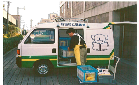
ブックコンテナで700冊を乗せて出掛ける配本車