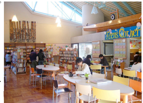
ティーンズのたまり場、ラーニングcommons