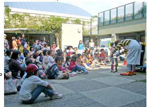
図書館の中庭ひろばでボランティアが人形劇

本に出会い、ものに出会い、人に出会い、自分を確かめるひとりでふと我に返る環境。緑陰の読書テラスへの要望は基本計画や設計の段階で実現への検討がされるでしょう。