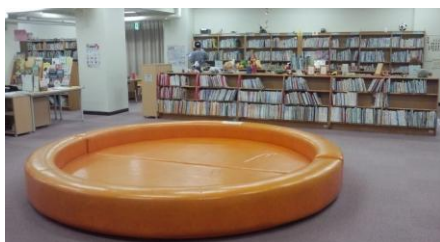
< こども図書室 >