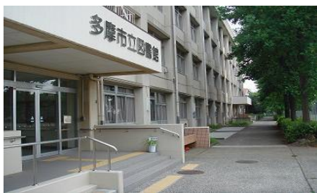
< 入口 >

1階は一般向図書、ティーンズコーナー、資格・スキルアップコーナーやシニアコーナー、テーマでの展示などがあり、ゆったりと長時間過ごせます。こども図書室では定期的におはなし会を行っていて、特にあかちゃん向きのおはなし会はにぎわっています。2階にはパソコンを持ち込める学習室、調べものをする閲覧室があります。