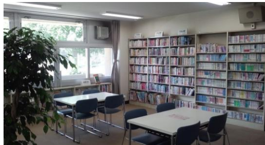
< ティーンズコーナー >