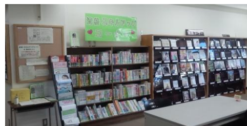
< 資格・スキルアップコーナー >