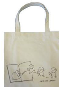
赤ちゃん向絵本のシンボル、ひよこをプリントしたバック