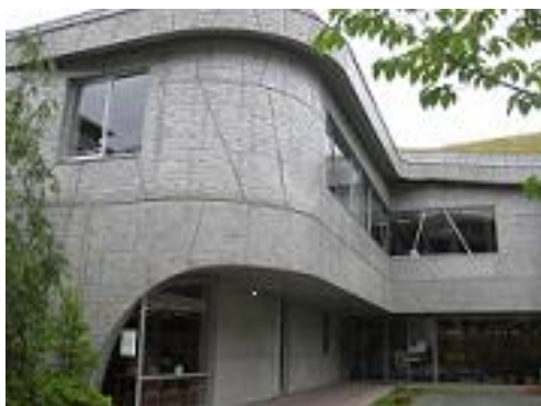
<からきだ菖蒲館の外観>