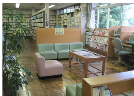
<新聞・雑誌コーナー>