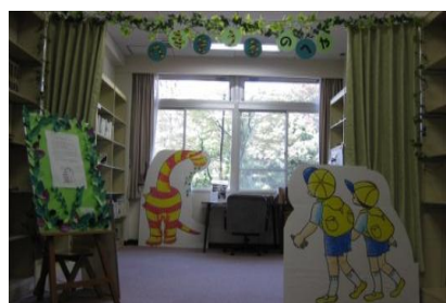
〈へなそうるのへや〉