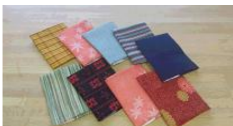
〈利用者から届いたお手製のブックカバー〉