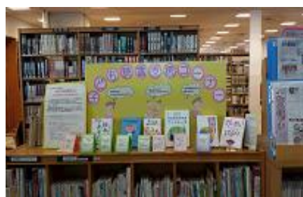
〈子ども読書支援コーナーを新設〉