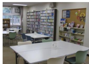
〈ティーンズコーナー〉