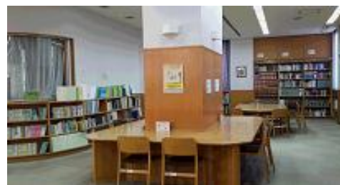
<静かな閲覧コーナー>