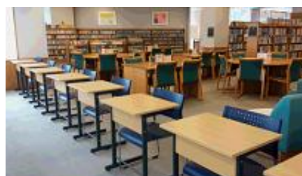
〈閲覧コーナーはいつもほぼ満席！〉