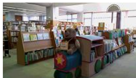
<大きなクマのぬいぐるみがお出迎え>