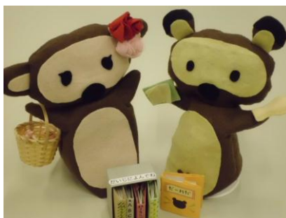
<唐木田図書館のマスコット・からきだぼんた>