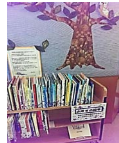
<木のタペストリーとお勧め本>