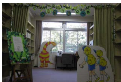
<へなそうるのへや>