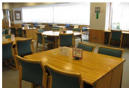
<閲覧コーナーはいつもほぼ満席！>