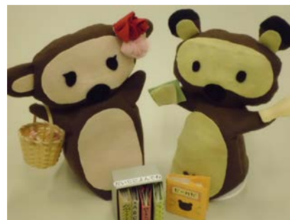
<唐木田図書館のマスコット・からきだぼんた>