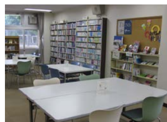
<ティーンズコーナー>