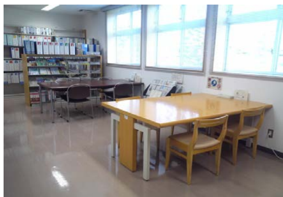
<閲覧スペース 2卓8席あります>