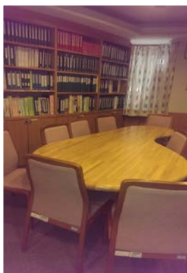
<障がい者サービス室もあります>