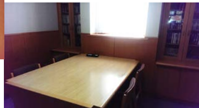
<視覚障がい者用の対面朗読室>