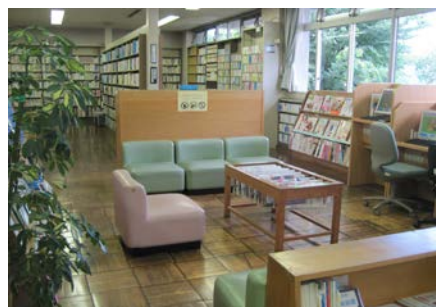
〈新聞・雑誌コーナー〉