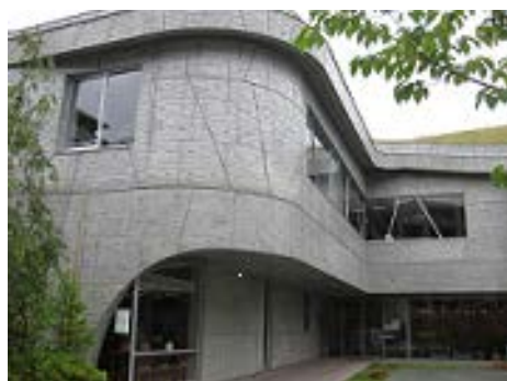
<からきだ菖蒲館の外観>