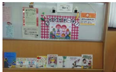
<児童書の展示コーナー>