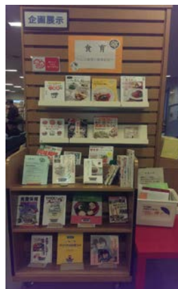
<企画展示コーナーは毎月変わります>