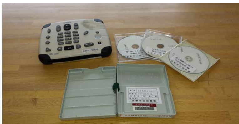
デイジー再生機(プレクストーク)