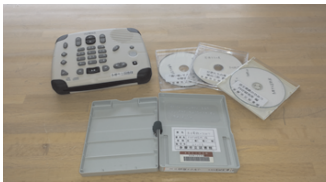
デイジー再生機(プレクストーク)