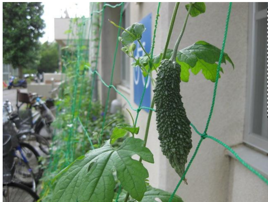
多摩市立図書館(本館)「グリーンカーテン」のゴーヤが育ってきました。