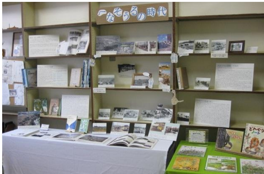
△図書館・本館1階 へなそうるのへや

2014.11.1 発行 第 204 号 多摩市立図書館 042-373-7955