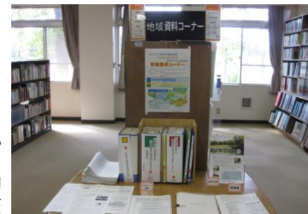
図書館本館内の「情報提供コーナー」

それぞれの取り組み、連携の進捗状況をお知らせできるように図書館本館・パルテノン多摩・グリーンライブセンター内に「 情報提供コーナー 」を開設しました。