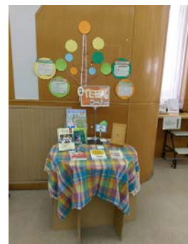
<ティーンズコーナー>