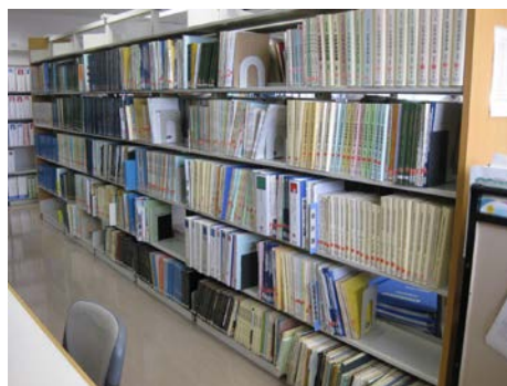
〈多摩市で発行した資料は部・課別に揃えてあります〉