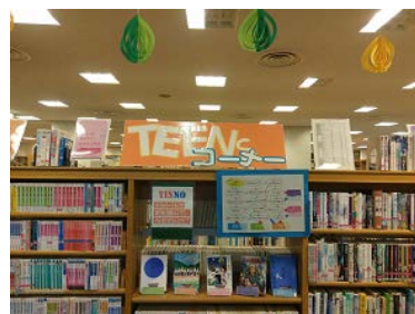
〈ティーンズコーナーの一角〉