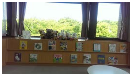
<児童書の展示コーナー>