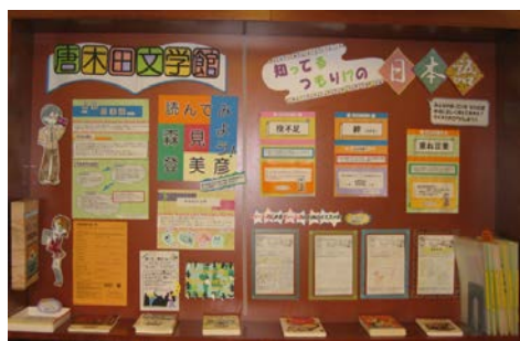
<ティーンズコーナー>