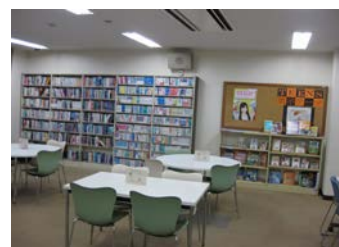
<ティーンズコーナー>