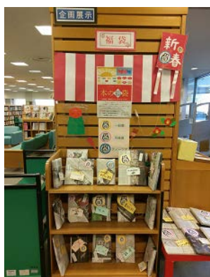
〈企画展示コーナー〉