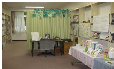
<へなそうるのへや>