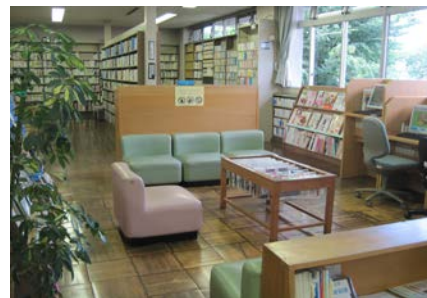
<新聞・雑誌コーナー>